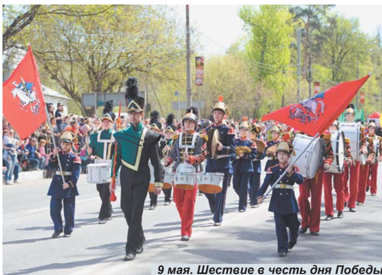
9 мая. Шествие в честь дня Победы

кину. Так что репертуар ансамбля постоянно расширяется.