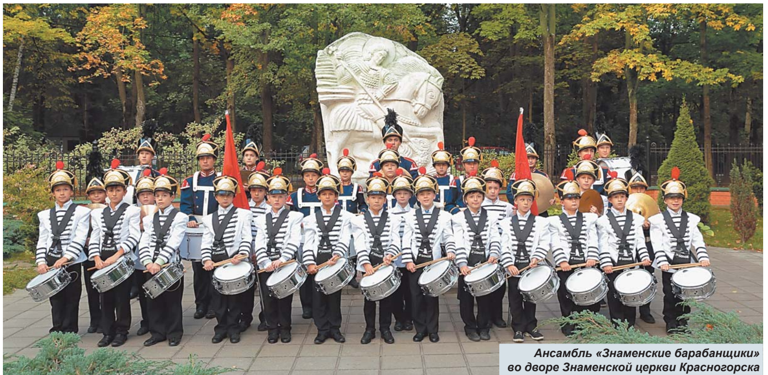
Ансамбль «Знаменские барабанщики» во дворе Знаменской церкви Красногорска

это действительно здорово! Ансамбль «Знаменские барабанщики» – один из самых известных музыкальных ансамблей в Красногорском районе и за его пределами. Можно сказать, что ансамбль стал одной из визитных карточек нашего района. Это уникальный проект, который реализуют муниципальный Центр духовной культуры и Знаменский храм Красногорска.