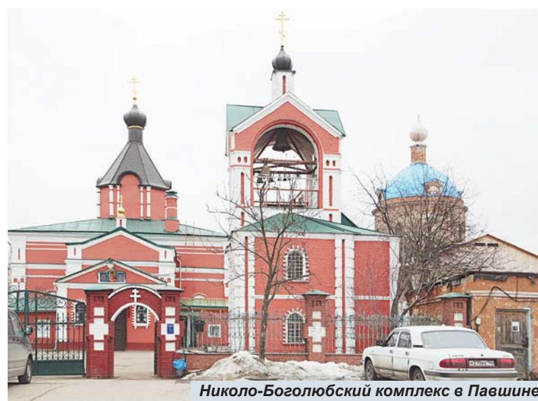
Никола-Боголюбский комплекс в Павшине

Как только храм был передан приходу, в нем стали читать по воскресным дням акафист святителю Николаю. В мае 2013 года над куполом церкви наконец был установ-