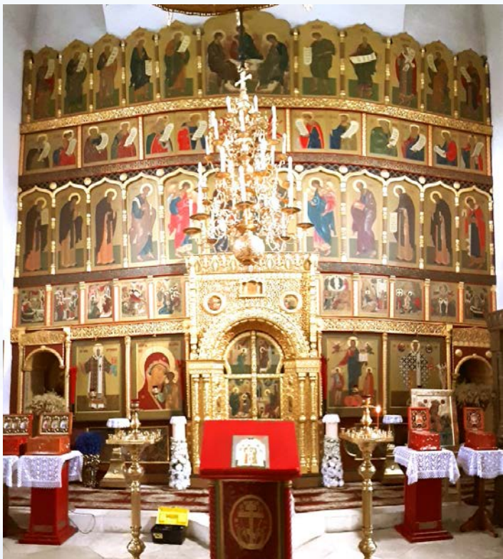
Храм святителя Николая в Николо-Урюпине. Внутреннее убранство. Наши дни.

взаимоподдержка и вот такие необычные явления. Среди них – радость открытия нижнего придела святых Михаила и Феодора, обновленного, яркого, где было гораздо больше места. Многие вспоминают, как невзначай подглядывали через смежные двери за реставрацией центральной части.