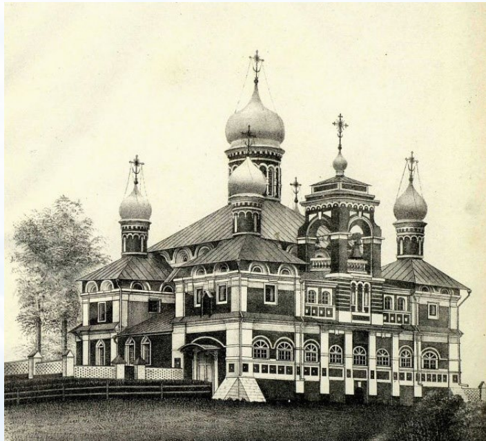
Храм до революции.

Согласно переписи вотчины 1685 – 1686 гг.: «За боярином за князем Никитою Ивановичем Одоевским вотчина его Никольское Урюпине тож, по обе стороны речки Липишны, а на вотчиникове земле по левую сторону церковь Николая Чудотворца каменная с приделами, по правую сторону придел благоверного князя Михаила Черниговского и боярина