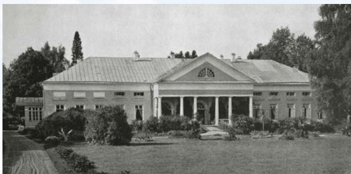
Белый домик. До обветшания.

Конечно, это служение коснулось и усадьбы Никольское-Урюпино. На месте предыдущих жилых строений появляется новый дворцово-парковый ансамбль. Его сердцевиной становится «Белый домик», который был построен в стиле классицизма около 1780 г. неизвестным архитектором. Данный парковый павильон отличался искусной обработкой фасадов и редкой красотой интерьеров. А его центральный «Золотой зал» был щедро украшен лепниной и фресковой росписью по эскизам знаменитого французского художника Ф. Буше.