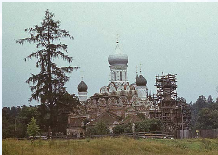
Никольский храм. 80-ые гг. XX в.

Началась долгая эпоха разрухи. В храме был сельский совет, склад, мастерские. Однако, 70 - 80-е гг. XX в. – время реставрации, благодаря которой само здание церкви устояло.